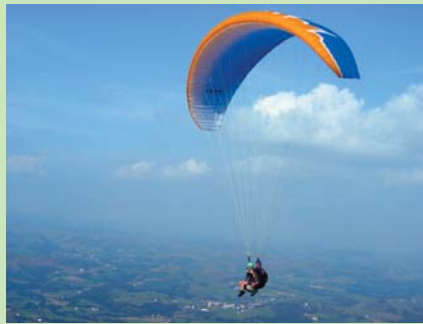
Vol en parapente

tracée dans la fougèraie qui domine une ancienne carrière. Puis à gauche entre les blocs.