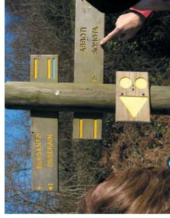
Une photo locale des sentiers ou balisage

Les itinéraires que nous vous proposons ont fait l'objet de la plus grande attention. Vos impressions et observations sur l'état de nos chemins, nous intéressent et nous permettent de les maintenir en état. Nous vous invitons à communiquer vos remarques en contactant l'office de tourisme précisé sur la fiche jointe. Vous pourrez vous y procurer une fiche d'observation Ecoveille®.